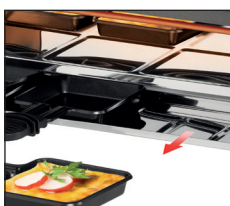
Integrierte, ausziehbare Pfännchenablage