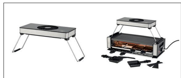
Abzugshaube Smokeless als Sonderzubehör Bestell-Nr. 487001