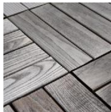
Natürlicher Farbton nach einigen Monaten ohne Behandlung