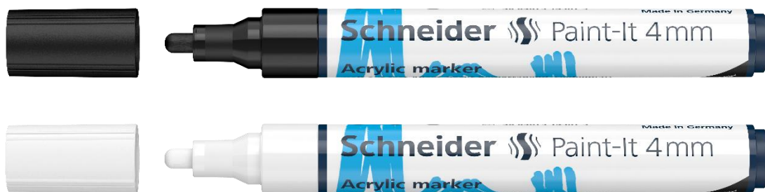
Abbildung: Paint-It 4 mm, Schreibfarbe schwarz (Art.-Nr. 120201) und weiß (Art.-Nr. 120249)