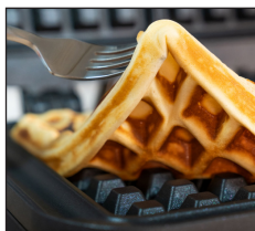
Antihaftbeschichtung für einfaches Ausbacken