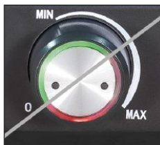
Stufenlose Temperaturregelung mit Kontrollleuchte