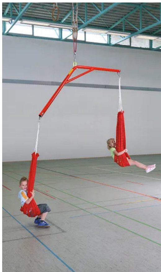
Abbildung 1: Schaukelwippe "Mobil"

Bewahren Sie die Anleitung gut auf. Für Fragen und Wünsche stehen wir Ihnen gerne zur Verfügung.