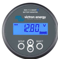
Bluetooth-Sensorik: BMV-712 Smart Batteriewächter