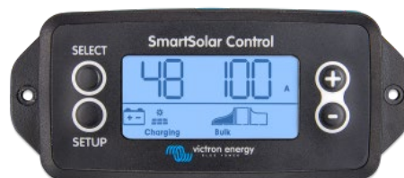
SmartSolar einsteckbares Display

Entfernen Sie einfach die Gummidichtung, die den Stecker an der Vorderseite des Reglers schützt und stecken Sie das Display ein.