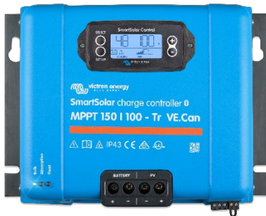
SmartSolar-Lade-Regler MPPT 150/100-Tr VE.Can mit Option einsteckbares Display