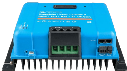
SmartSolar-Lade-Regler MPPT 150/100-Tr VE.CAN ohne Display