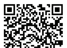
MSI Current Promotions