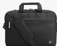
HP Professional 14,1 Zoll Laptop-Tasche 500S8AA