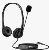
HP Stereo-USB-Headset G2 428H5AA