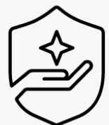
3 Jahre Abhol- und Lieferservice U4819E