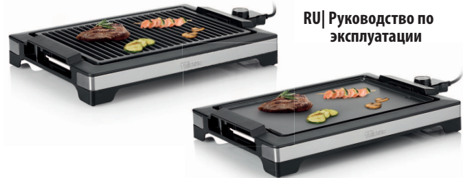
BP-2780 / BP-2781

PARTS DESCRIPTION / ONDERDELENBESCHRIJVING / DESCRIPTION DES PIÈCES / TEILEBESCHREIBUNG / DESCRIPCIÓN DE LAS PIEZAS / DESCRIÇÃO DOS COMPONENTES / DESCRIZIONE DELLE PARTI / BESKRIVNING AV DELAR / OPIS CZĘŚCI / POPIS SOUČÁSTÍ / ПОИС СОУЧАСТІ / ПИСАННЕ ЗАПЧАСТІ