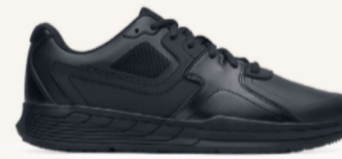
Condor II Schwarz: 22270